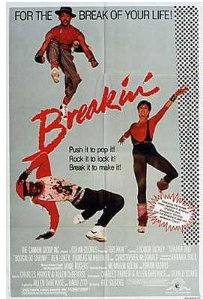
De poster van breakdance-film 'Breakin'.