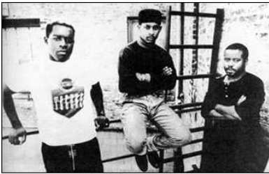
L-R: Saunderson, May and Atkins

Kevin Saunderson, Derrick May en Juan Atkins, de aartsvaders van de Detroit techno.