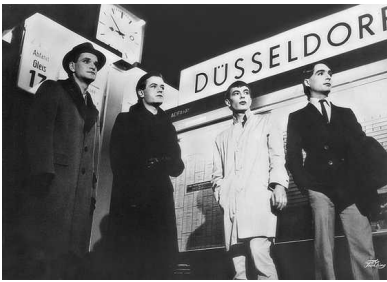
Kraftwerk, foto uit 1977 of 1978, gemaakt op het station van Düsseldorf.