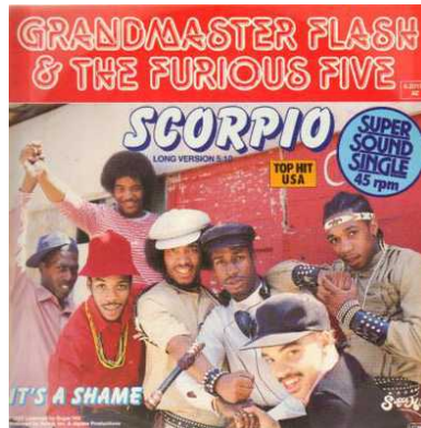
Hiphop/electro: het nummer Planet Rock leunde zwaar op Kraftwerk en beïnvloedde op zijn beurt weer de hiphop die erop volgde, zoals van Grandmaster Flash en zelfs jazzpianist Herbie Hancock.