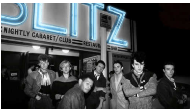
Synthpop: het gebruik van de synthesizer kreeg al direct veel navolging. Visage voor The Blitz Club.